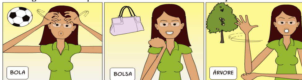
Figura 1 – Exemplo de material utilizado na alfabetização em LIBRAS