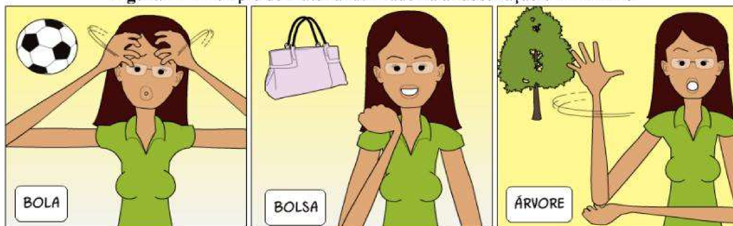
Figura 1 – Exemplo de material utilizado na alfabetização em LIBRAS